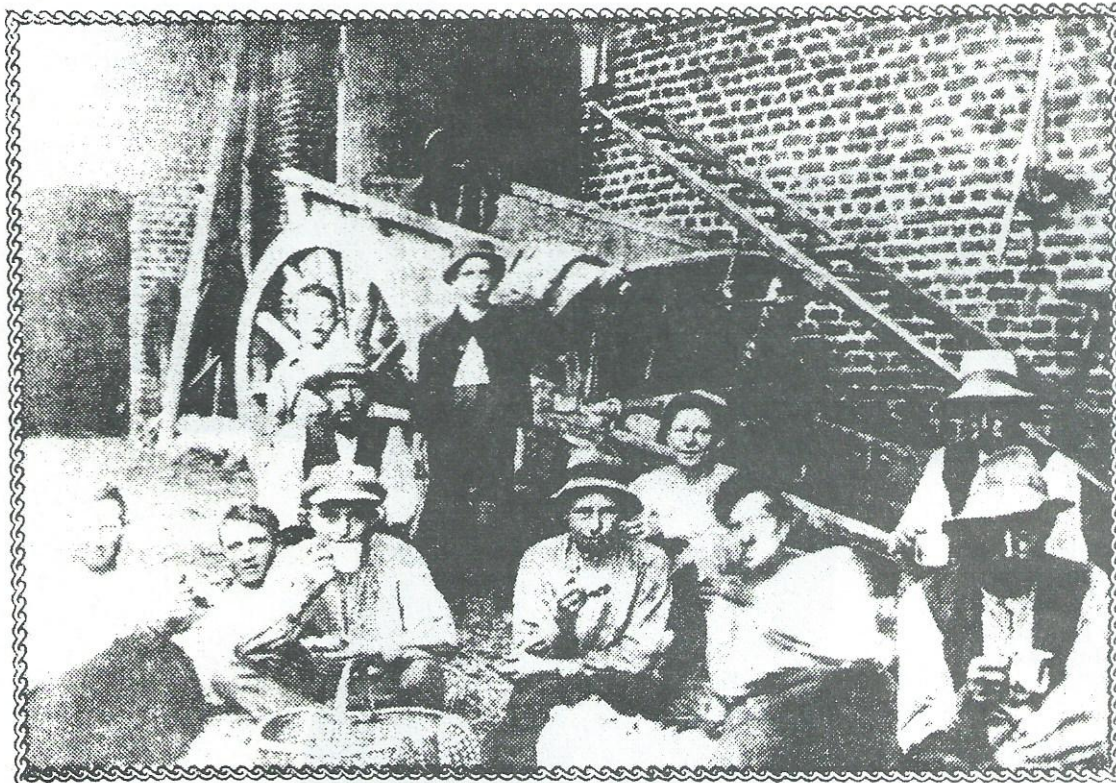
* Tot zo'n zestig jaar geleden leek de geschiedenis van de gewone man ogenschijnlijk nauwelijks veranderd te zijn, zoals blijkt uit deze middeleeuws aandoende foto van een groep schaftende werklieden van Genhoves in Wijnandsrade

spreken. Het idee van de grootschaligheid spreekt hen niet aan. Daar hebben ze de neus vol van.