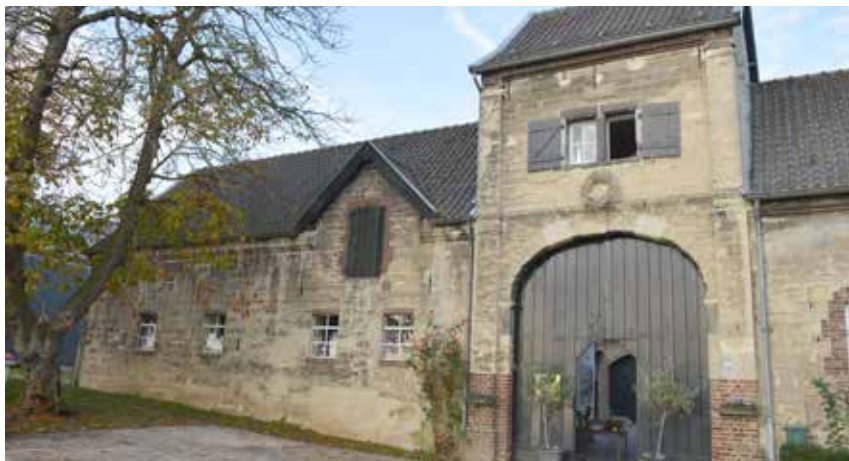
De Nieuwe Bongard.