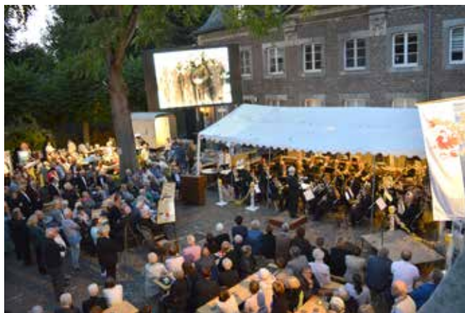
Sfeerimpressie bevrijdingsconcert.