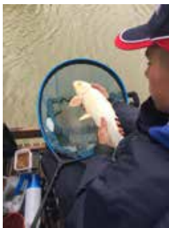
Meteen een goede vangst

grind en kubieke meters grond werden gebruikt om een stabiele constructie te maken. Het karwei werd afgesloten met een gezellige bijeenkomst en vooral, een goed dorpsgevoel. Het laatste jaar heeft de HSV Wijnandsrade zich sterk ontwikkeld. Uiteraard was het vernieuwen van de visvijver een belangrijk moment, met de nodige media-aandacht en bijzondere activiteiten. Zo hield de vereniging in samenwerking met Sportvisserij Limburg een jeugdvisdag voor jongens en meisjes uit de hele regio. Meedoen was gratis en alle attributen werden gratis ter beschikking gesteld met natuurlijk, na afloop een hapje en een drankje. Er was veel aandacht voor deskundige uitleg over de vissport. Inmiddels telt de vereniging vierenvijftig leden, waaronder veertien jeugdleden. Naast bijvoorbeeld wedstrijden met de vaste hengel op witvis zijn er workshops waarbij techniek en gebruik van materialen aan de orde komen. Voor de leerlingen van de basisschool uit groep 7 en 8 wordt jaarlijks het schoolvissen georganiseerd, waarbij de deelnemende jeugd gratis een visvergunning krijgt voor dat jaar.