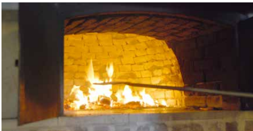
Oavevuur in d'r bakaove.