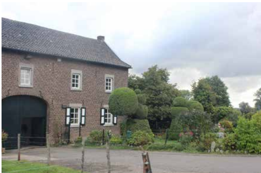
Hoeve Laar.

Wynants Ze konden niet nog meer koeien melken, omdat de koeien dagelijks de spoorweg over moesten om gemolken te worden. De omknelling door het reïnsponor dat sinds 1896 vlak achter de boerderij loopt als ook de autosnelweg, die langs de voorzijde van de boerderij loopt, hebben hun werkzaamheden op de boerderij niet altijd even makkelijk gemaakt. Hierdoor is de boerderij enkel bereikbaar via de onderdoorgang van 3,5 meter hoogte, die onder de autosnelweg doorloopt.