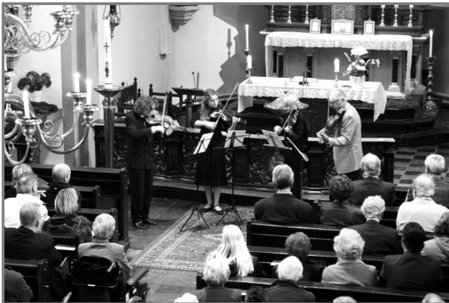
Optreden van ArcAngeli