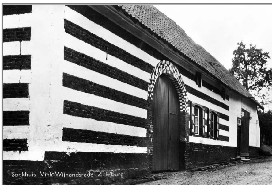
't Sjekhoes op de Vink, circa 1950 (uit het archief van de heemkundevereniging)

Van het ijzerdraad maakten de kinderen ook vaak brilletjes die ze opzetten wanneer er 'schooltje' werd gespeeld. Degene die de leraar speelde, droeg een bril om 'een wijze indruk' te maken. Mergel dat ze van een zijmuur van de sjansenoven afkaptten, werd gebruikt als krijt, waar ze mee schreven.