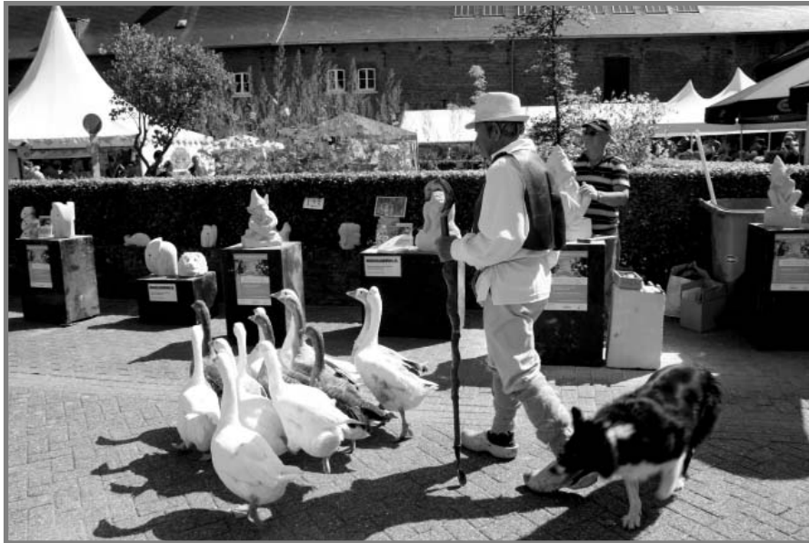
Het Cultuur- en Folklorefestival