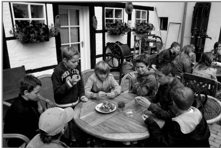
Bezoek aan het Boerderijmuseum in Schimmert