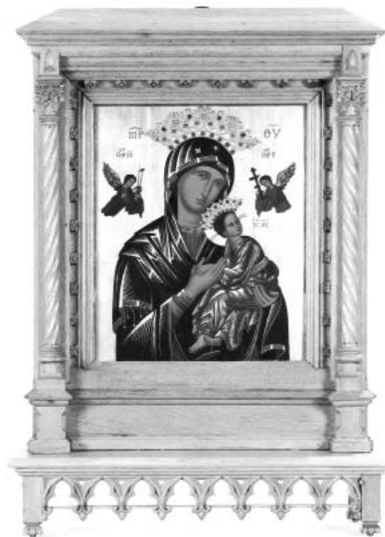
Afbeelding van OLVAB in de St. Stephanuskerk

De originele icoon werd in Rome aanvankelijk bewaard in de (kerk van) San Matteo (Merulana), maar tegenwoordig in de (kerk van) Sant' Alfonso op de Esquilijnse heuvel. Dit is niet zomaar toevallig de hoofdkerk van de Congregatie van de Allerheiligste Verlosser ofwel de Redemptoristen (CSsR). De heilige Alfonsus de Liguori is immers de stichter van deze congregatie. Het zijn dan ook vooral de Redemptoristen die veel aan de verspreiding van de devotie tot Onze Lieve Vrouw van Altijddurende Bijstand hebben bijgedragen, vooral