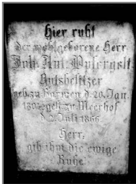
Gedenksteen van overgrootvader Opfergelt