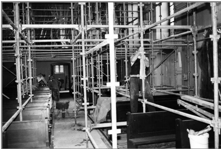
Herstel van de aardbevingschade aan de St. Stephanuskerk

In de nacht van 13 april 1992 trof een ernstige aardbeving de provincie Limburg. Het epicentrum lag nabij Herkenbosch, maar het geweld ging ook niet aan Wijnandsrade voorbij; in het bijzonder niet aan de parochiekerk. De 'Sint Stephanus' liep aanzienlijke schade op, met name in de muren en gewelven. Daar bleek scheurvorming te zijn ontstaan, die niet al te lang op herstel kon wachten. En daarnaast moest het metsel- en stukadoorswerk op vele plaatsen worden hersteld, terwijl het hele interieur van de kerk opnieuw moest worden geschilderd. Een arbeidsintensieve, maar vooral dure operatie. De totale schade viel zo hoog uit, dat de officiële kerkelijke en wereldlijke noodfondsen en subsidies verre van voldoende geld opleverden om voor een volledige restauratie garant te staan.