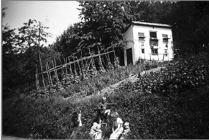
Duivenhok