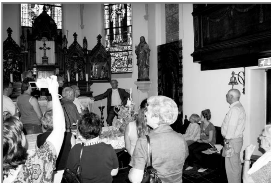
Rondleiding in de St. Stephanuskerk