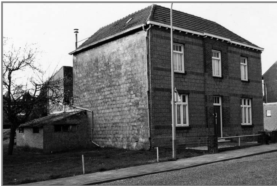
Het huis van de familie Neven-Ritzen

Het pand werd in 1927 met betonblokken gebouwd, die door de heer Neven zelf waren gestort. Na zijn overlijden in januari 1988 is de woning in april van dat jaar gesloopt. Op het vrijgekomen perceel zijn twee nieuwe huizen gebouwd (de nummers 32 en 34).