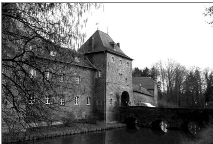
Huis (kasteel) Kellenberg