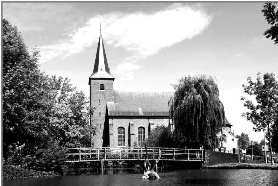
De St. Stephanuskerk