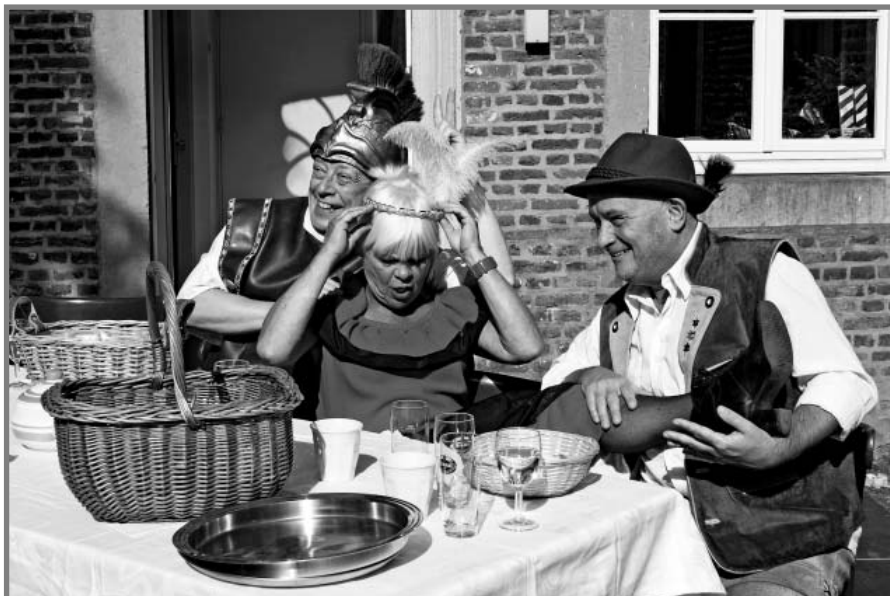
Het blijspel Proemevlaai, geschreven door Colla Bemelmans en Wiel Oehlen en vertolkt door toneelvereniging Kunst na Arbeid