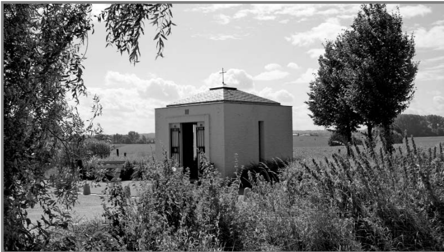
De Isidoruskapel van Swier

Wandelend door Swier langs de hoofdweg valt het je op dat deze buurtschap zo anders is dan het kerkdorp Wijnandsrade, waar het vlak bij ligt.