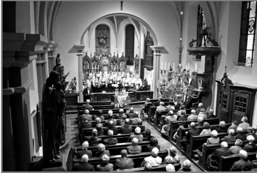
Optreden van Cantus ex Corde