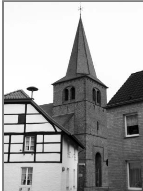
Kerk van Boslar

De wieg van de eerste “Röadsjer” Opfergelt stond in Duitsland, in het Jülicher Land. Hij werd in 1854 geboren in de gemeente Titz, om precies te zijn in het dorpje Spiel, om nog preciezer te zijn in de buurtschap Meerhof (Meerhöfe).